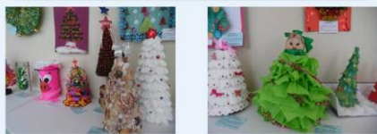
На выставке представлены 52 работы